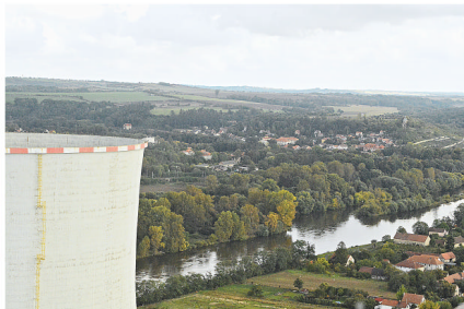
Pohled na Liběchov s vrchu elektrárny