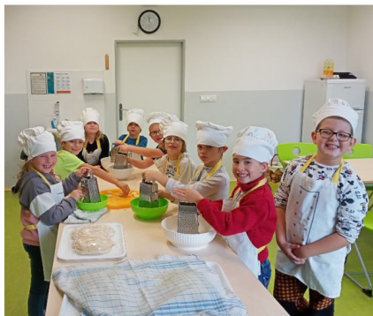
Malí kuchtíci ze ZŠ a MŠ Václava Levého Liběchov

• Od 1. listopadu byl DSO Boží Voda nucen přistoupit ke zvýšení ceny pitné vody. O výpočtu vodného podrobně píšeme na straně 3.