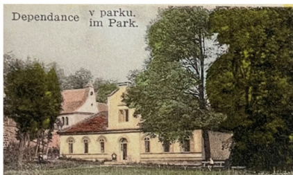
Nový empírový lázeňský pavilon z roku 1804 v lázeňském parku na Boží Vodě, nadstavba ve střechě z roku 1926. Pohlednice z roku 1928