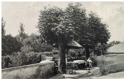
Letní posezení na nástupní schodišťové terase před budovou penzionu s restaurátem. Pohlednice z roku 1928

(Zkrácená verze textu informační tabule umístěné poblíž kaple Panny Marie na Boží Vodě. Fotografie pocházejí z knihy Liběchovsko na starých pohlednicích, nakladatelství Baron, Hostivice 2016 .)