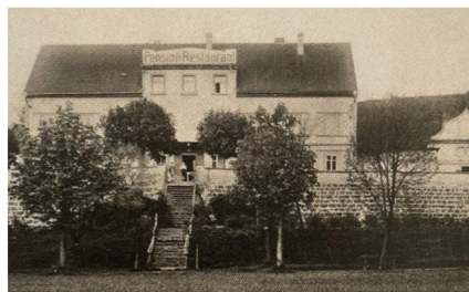
Původní barokní lázeňská budova, roku 1926 přestavěná na penzion s restaurátem; v čele schodiště, které propojuje budovu s lázeňským parkem, opravo částečně patrně průčelí barokního sklepa s letopočtem AD 1755. Pohlednice, r. 1930

dřevěným schodištěm. Nová lázeňská budova s přilehlým parkem byla se zámek a Liběchovem propojena lázeňskou promenádou, lemovanou stromořadím kaštanů, které však za kruté zimy v letech 1927–1928 vymrzly a později je nahradily dnešní lípy. V 19. století byla na Boží Vodě vystavěna řada nových lázeňských domů a penzionů. Ve dvacátých letech 20. století byl lázeňským lékařem MUDr. Ernst Fröhlich, v letech 1905–1931 starosta Liběchova. Pravděpodobně v souvislosti se všeobecnou hospodářskou krizí koncem dvacátých let provoz lázní na Boží Vodě ustává. Velký barokní lázeňský dům, který počátkem 20. století sloužil i jako špitál, byl v roce 1926 přestavěn na penzion s restaurátem. Po druhé světové válce byl penzion využíván jako rekreační středisko ROH. Dnes slouží jako bytový dům, barokní podobu si bohužel nezachoval.