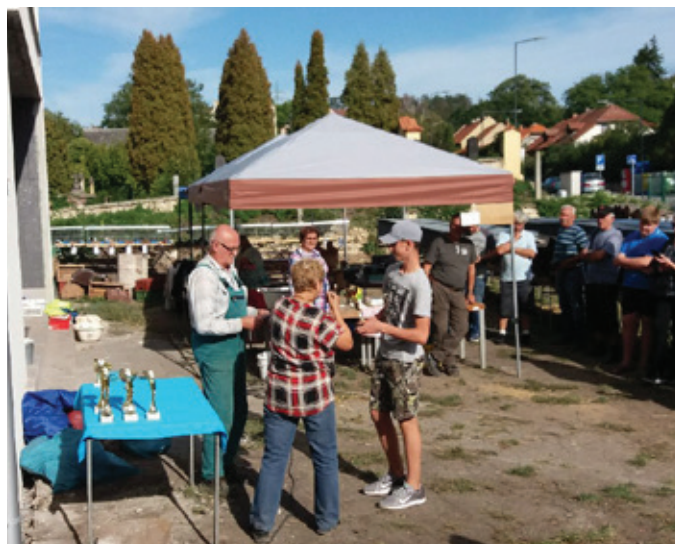
Závěrečné vyhodnocení soutěže a předávání pohárů

Chovatelé vystavili také 35 kusů holubů, za nejlepšího byl předán pohár, a dále byly rozdány tři čestné ceny.