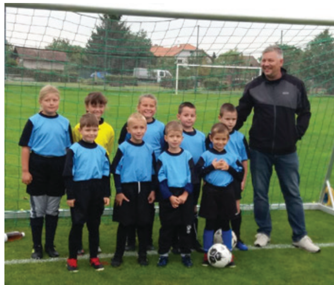
Družstvo mladší přípravy před svým prvním zápasem

Fotbalisté mají za sebou podzimní část soutěží. SK Liběchov v okresních soutěžích úspěšně reprezentovaly tři týmy.