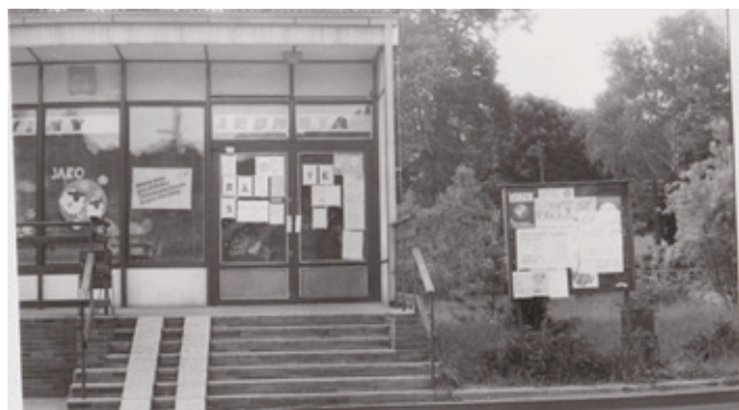
Jako plakátovací plocha posloužila výloha místní samoobsluhy i při prvních svobodných volbách v červnu 1990