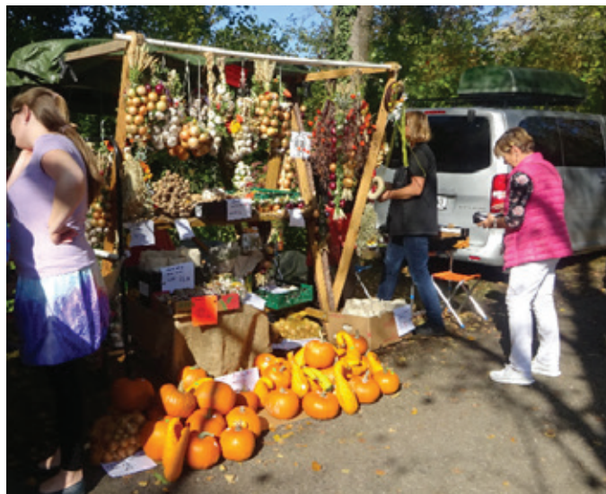
Svatohavelské posvícení 2019