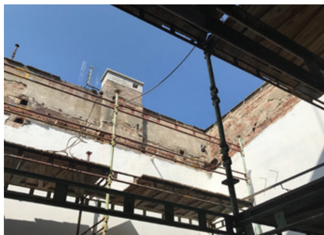
Stavební práce v sokolovně

V současné době se provádí stavebně-historický průzkum, několik průzkumů bylo již dokončeno. Vzhledem k tomu, že v objektu není zavedena