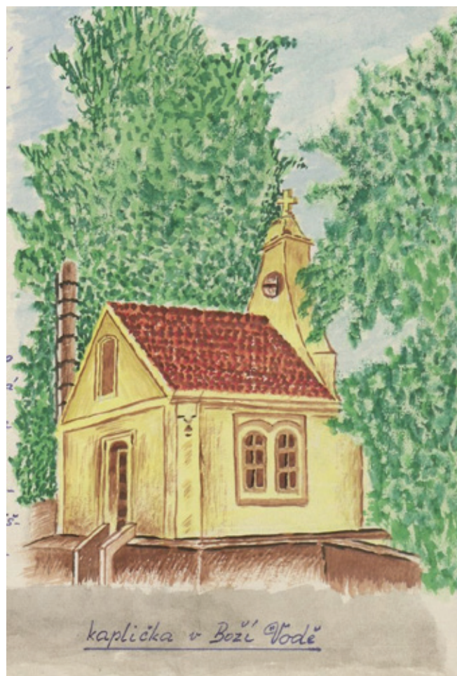
Kresba V. Doubka z Kroniky Liběchova, rok 1974