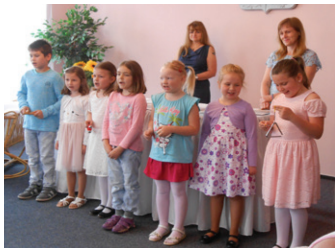
Děti ze ZŠ Liběchov vystoupily na Vítání občánků